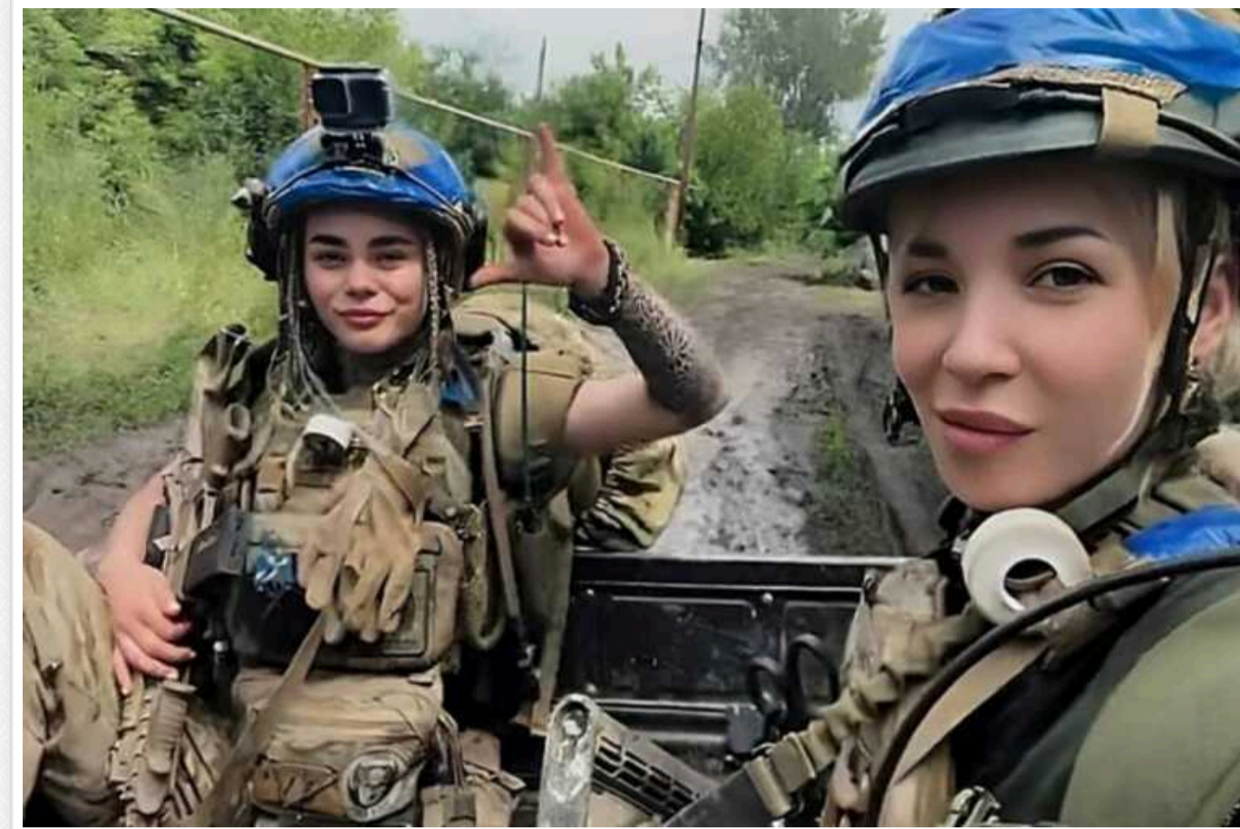
Україна все частіше почала залучати жінок до виконання завдань в армії