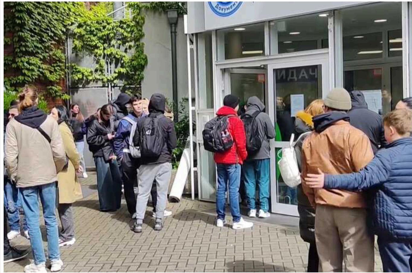
Примусового повернення українців із ЄС не буде, - Стефанішина

За словами Ольги Стефанішиної, облік у ТЦК не означає "автоматичну мобілізацію на фронт". Рішення України оновити дані спрямоване на визначення потенціалу мобілізації, пояснила віцепрем'єрка.