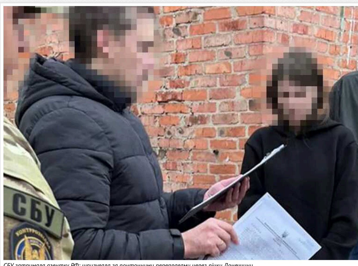
СБУ затримала агентку РФ: шпигувала за понтонними переправами через річки Донеччини

Контррозвідники Служби безпеки викрили в Слов'янську 25-річну агентку воєнної розвідки Росія, яка збирала дані про передислокацію підрозділів ЗСУ до передової. Серед іншого жінка шпигувала за понтонними переправами через річки Донеччини.