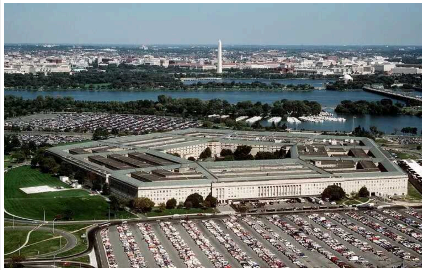
У США експіробітника Пентагону засудили до 21 року в'язниці за шпигунство на користь Росії

У Сполучених Штатах Америки до 21 року позбавлення волі засудили колишнього співробітника Агентства національної безпеки за шпигунство на користь Росії. 32-річний підсудний передав кілька документів під грифом цілком таємно співробітникові ФБР, якого він вважав представником російських спецслужб.