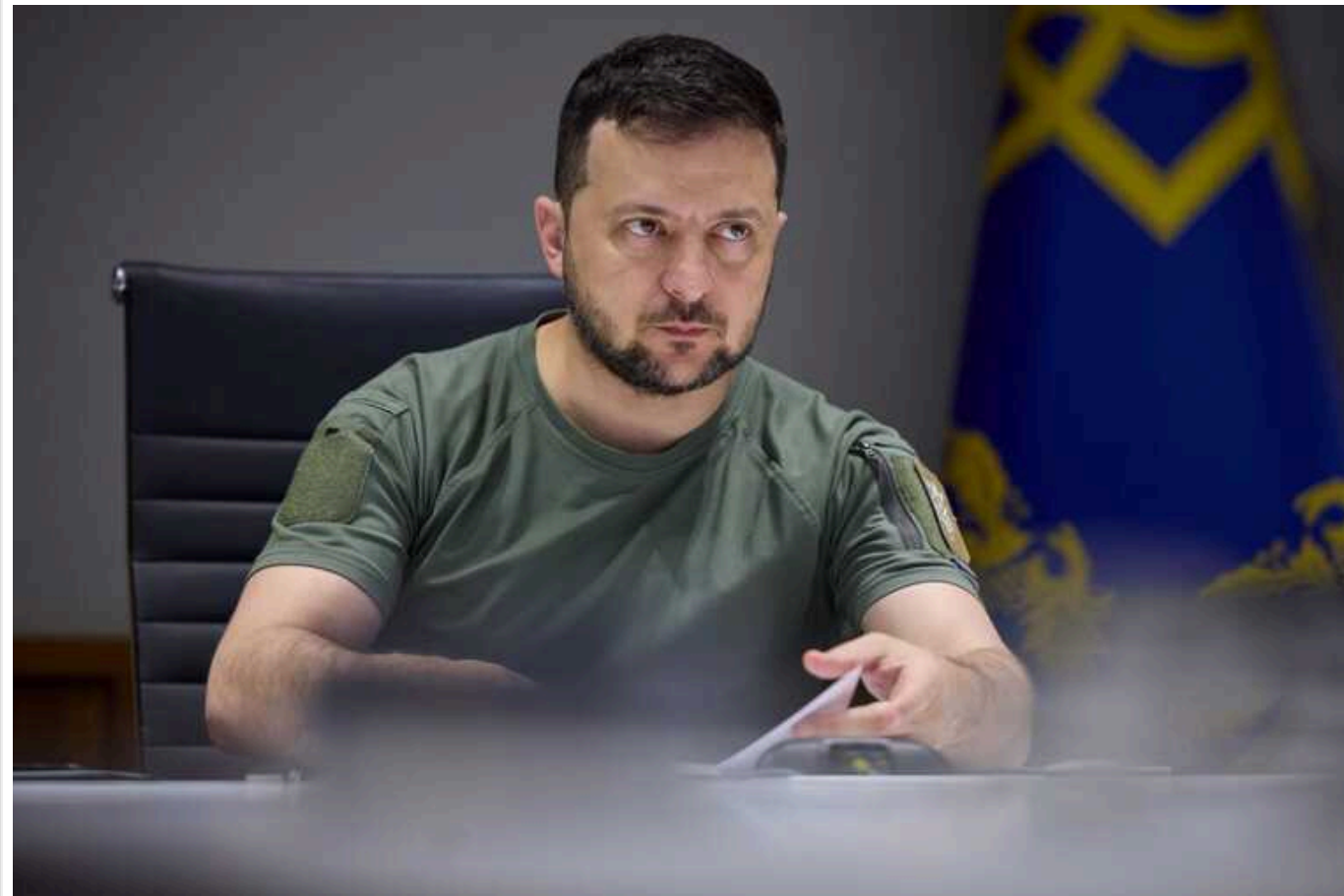
Зеленський провів Ставку: заслухав доповіді по фронту та обміну полоненими

Президент Володимир Зеленський сьогодні, 29 квітня, провів засідання Ставки верховного головнокомандувача. Було обговорено декілька ключових питань.