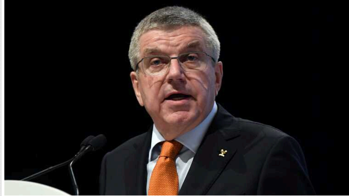
Президент МОК Томас Бах пригрозив росіянам дискваліфікацією на Олімпіаді-2024

Російські спортсмени зітвонуться із жорсткою реакцією з боку Міжнародного олімпійського комітету (МОК) у разі порушення правил допуску до змагань. Зокрема, представникам РФ загрожуватиме негайна дискваліфікація за демонстрацію символів агресії проти України.