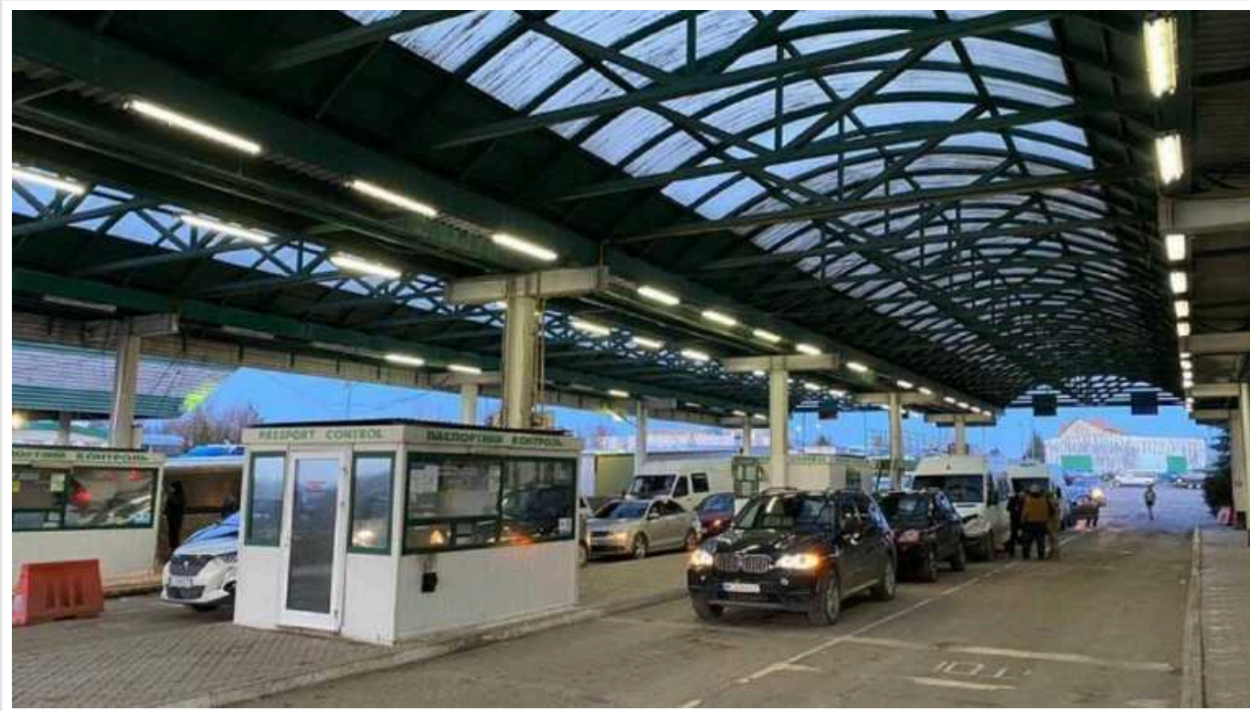
Польські фермери розблокували всі пункти пропуску на кордоні з Україною, проте не пропускатимуть вантажівки, які перевозять зернові культури