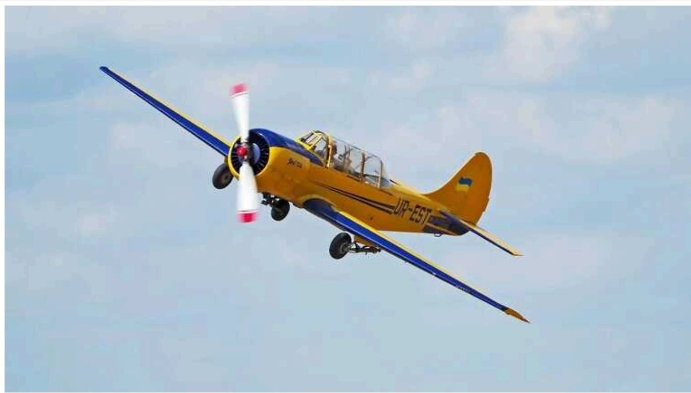
Український кулеметник на задньому сидінні гвинтового літака збиває російський безпілотник: тактика Першої світової війни повертається

Видання Forbes пише, що тактика Першої світової війни повертається: український кулеметник на задньому сидінні гвинтового літака збиває російський безпілотник.