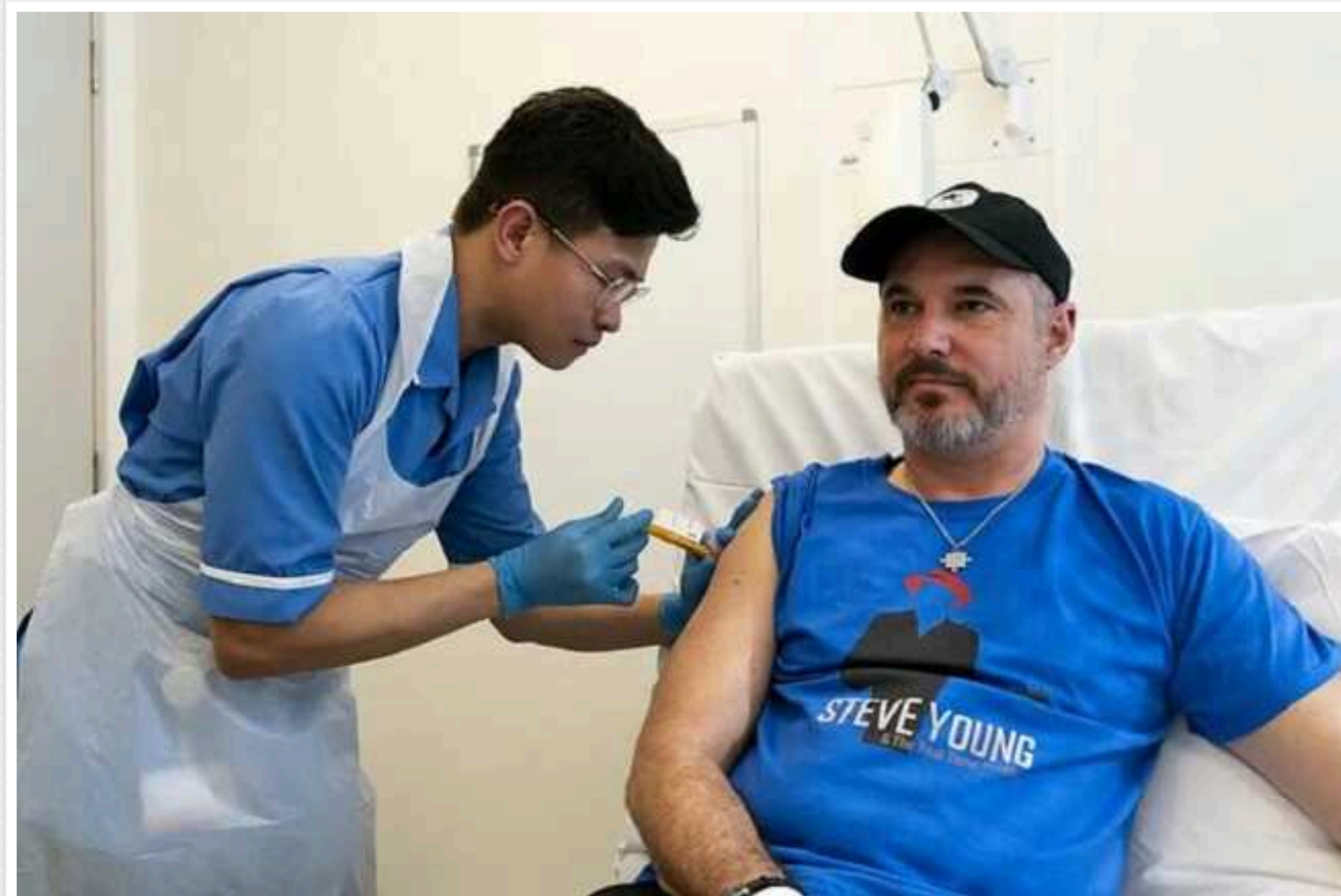
Пройшли фінальні випробування першої у світі «індивідуальної» вакцини від меланому, – The Guardian

The Guardian пише, що перша у світі персоналізована вакцина від раку на основі мРНК пройшла у фінальну стадію випробувань.