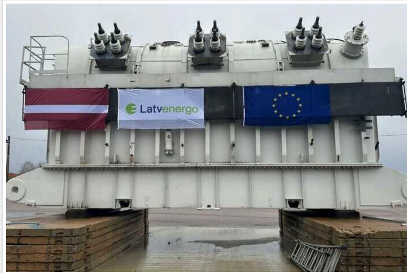
Латвія передала Україні обладнання для відновлення енергетики

Акціонерне товариство Latvenergo передало Україні пакет допомоги, що містить обладнання для відновлення пошкодженної внаслідок російських атак енергетичної інфраструктури.