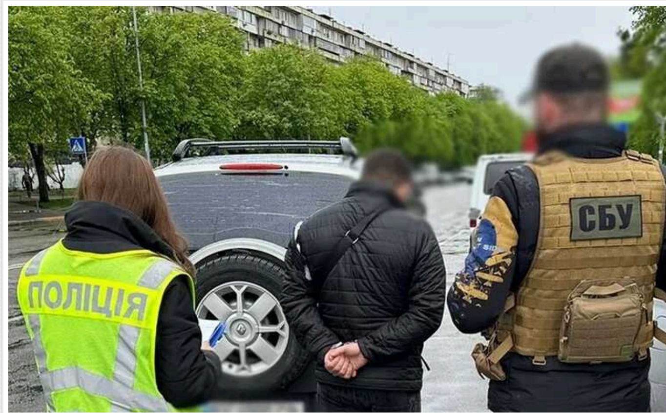
У Києві на гарячому затримали посадовця, який вимагав хабар за дозволи на вивезення тварин за кордон

У Києві на хабарництві викрили посадовця Управління держконтролю. Зловмисник, за інформацією слідства, хотів отримати гроші за дозволи на вивезення кролів за кордон.