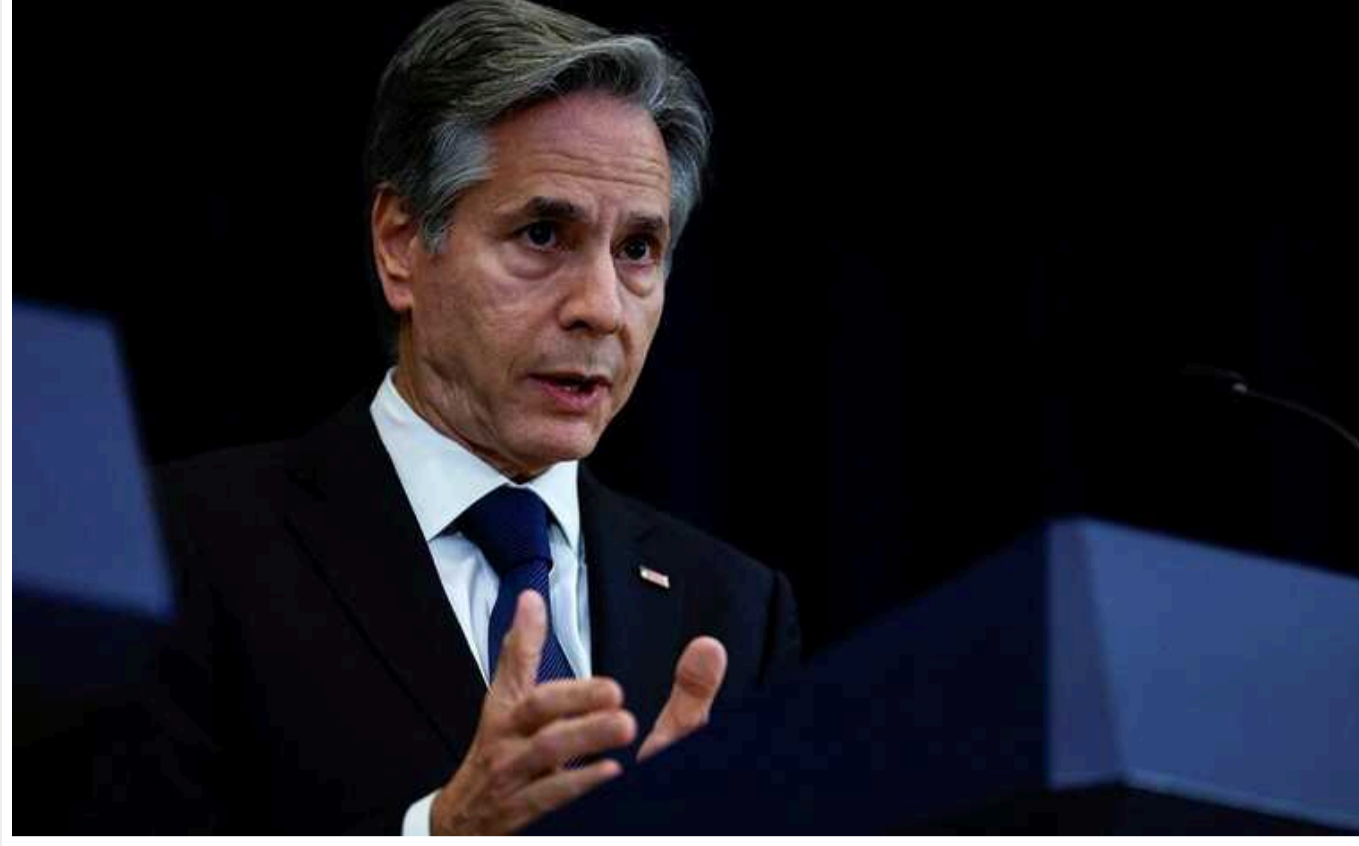
Блінкен провів телефонну розмову із главами Вірменії та Азербайджану

Держсекретар США Антоні Блінкен провів телефонну розмову з президентом Азербайджану Ільхамом Алієвим та прем'єр-міністром Вірменії Ніколом Пашиняном, під час якого порушувалося питання мирних переговорів між сусідніми країнами.