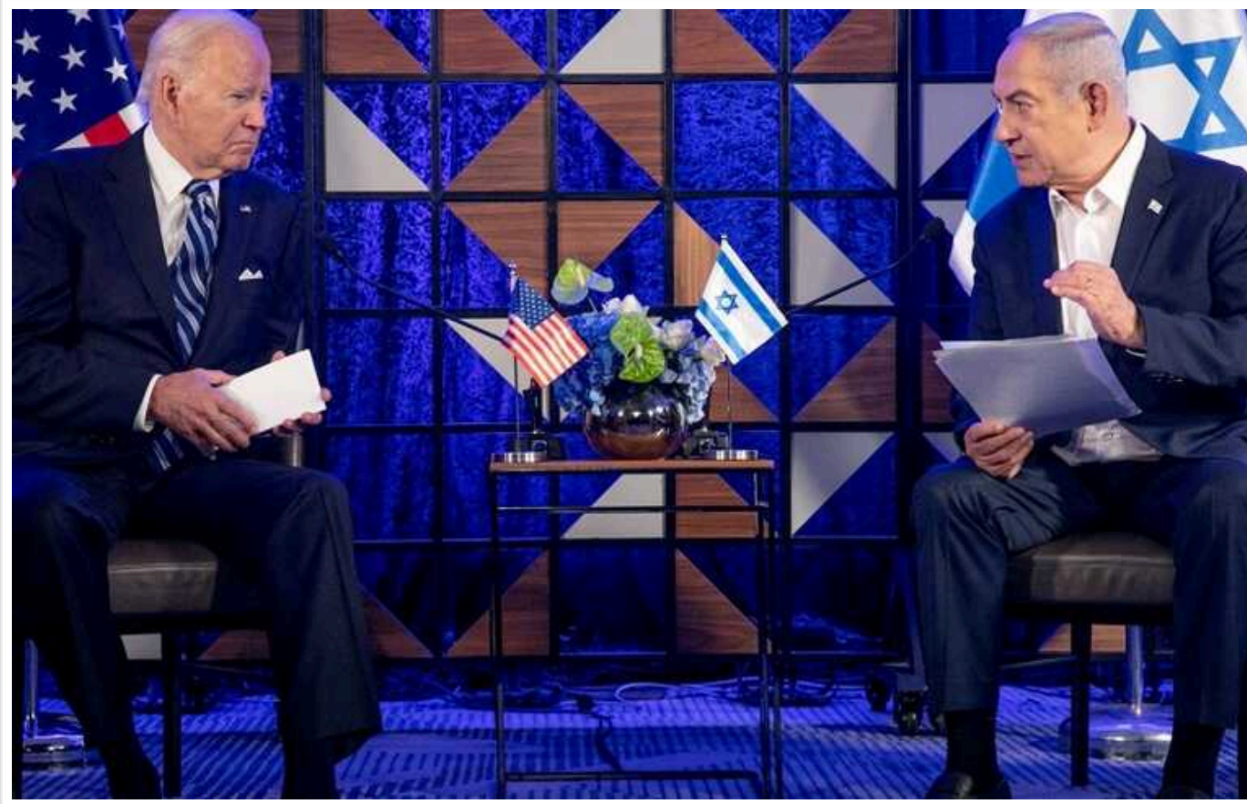
Байден та Нетаньягу домовилися відкрити нові пункти пропуску для доставки допомоги в Сектор Гази

Президент Сполучених Штатів Америки Джо Байден та прем'єр-міністр Ізраїлю Беньямін Нетаньягу обговорили відкриття додаткових пунктів пропуску в Секторі Гази, де ЦАХАЛ продовжує наземну операцію. Нові КПП потрібні для того, щоб доставляти до анклаву більше гуманітарної допомоги.