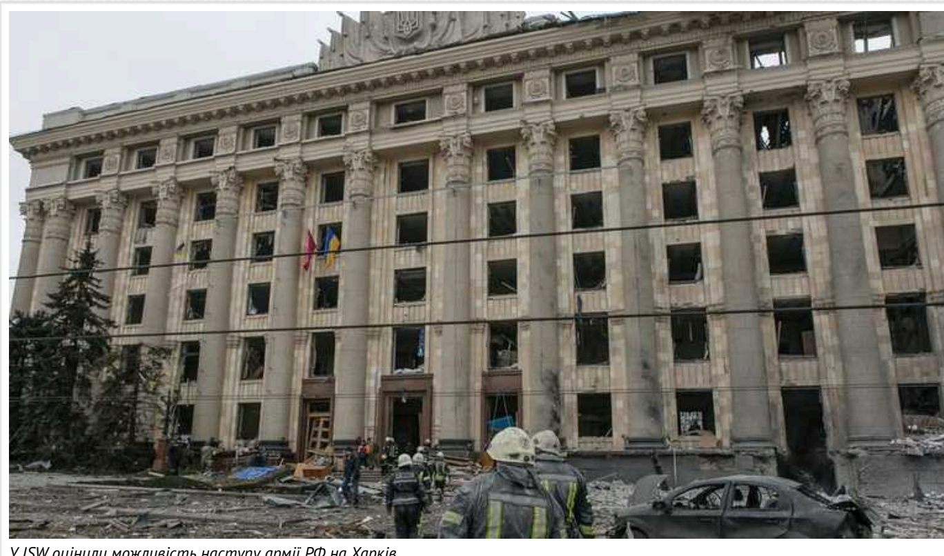
У ISW оцінили можливість наступу армії РФ на Харків

Загроза майбутньої наступальної операції Росії проти Харкова, новини про яку спливають у медіа, змушує Україну виділяти додаткові ресурси для його захисту. Однак і командування ЗСУ, і військові експерти наголошують, що окупантам не вистачає сил, необхідних для захоплення другого за величиною міста України.