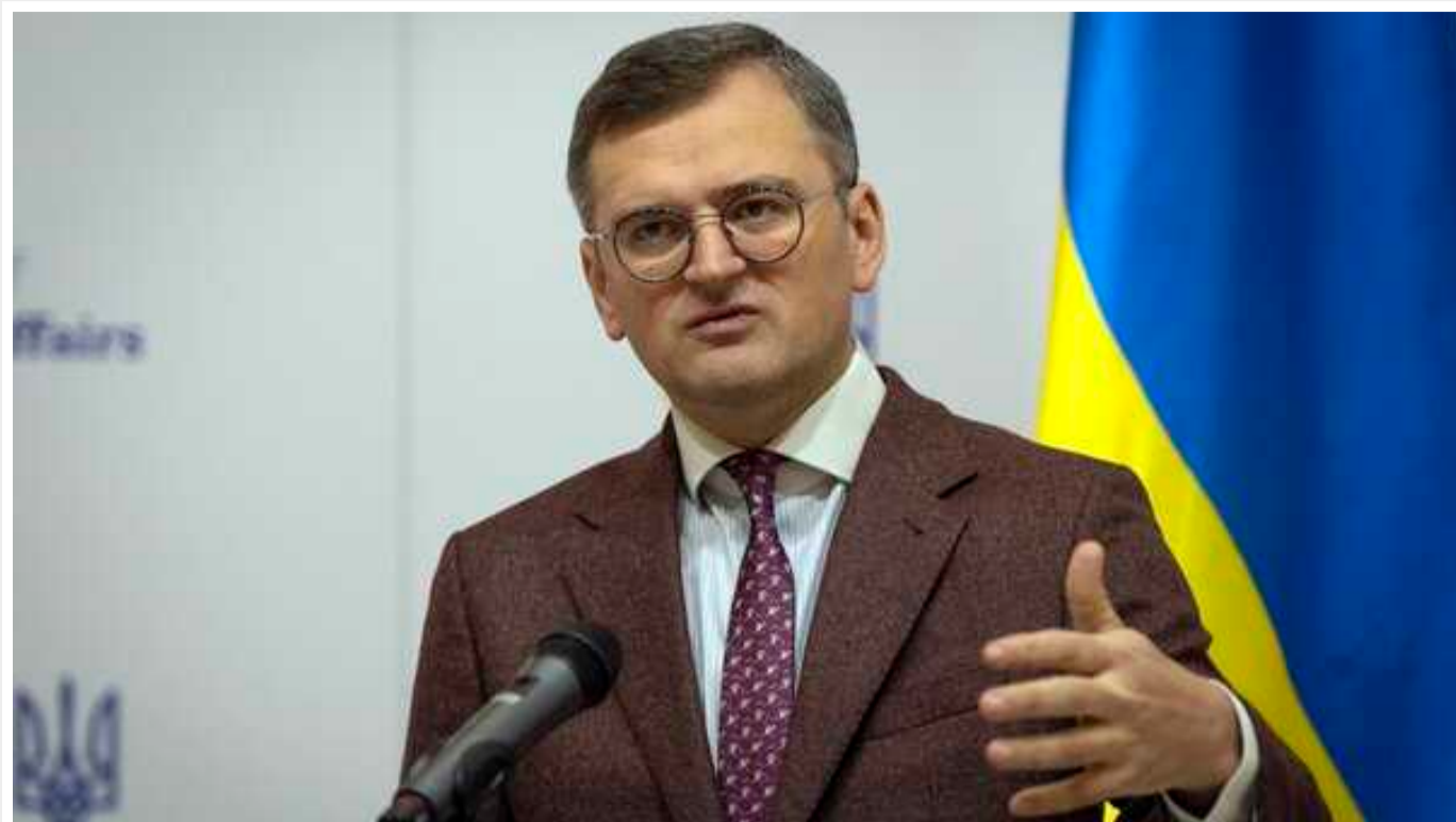
Кулеба доручив дипломатам тримати справу щодо вбивства у Німеччині українських військовослужбовців на особливому контролі

Дипломати мають взяти на особливий контроль справу про вбивство двох українських військовослужбовців у Німеччині.