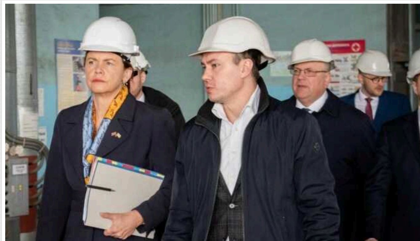
Глава МЗС Латвії відвідала в Україні пошкоджені РФ енергооб'єкт

Міністерка закордонних справ Латвії Байба Браже та заступник міністра енергетики України Микола Колісник ознайомилися з роботою одного з енергетичних об'єктів, який пошкодили російські терористи.