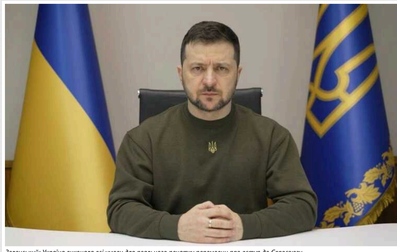
Зеленський: Україна виконала всі умови для реального початку перемовин про вступ до Євросоюзу

Україна виконала всі умови для реального початку перемовин щодо вступу до Євросоюзу, і тепер свої зобов'язання має виконати сторона ЄС.