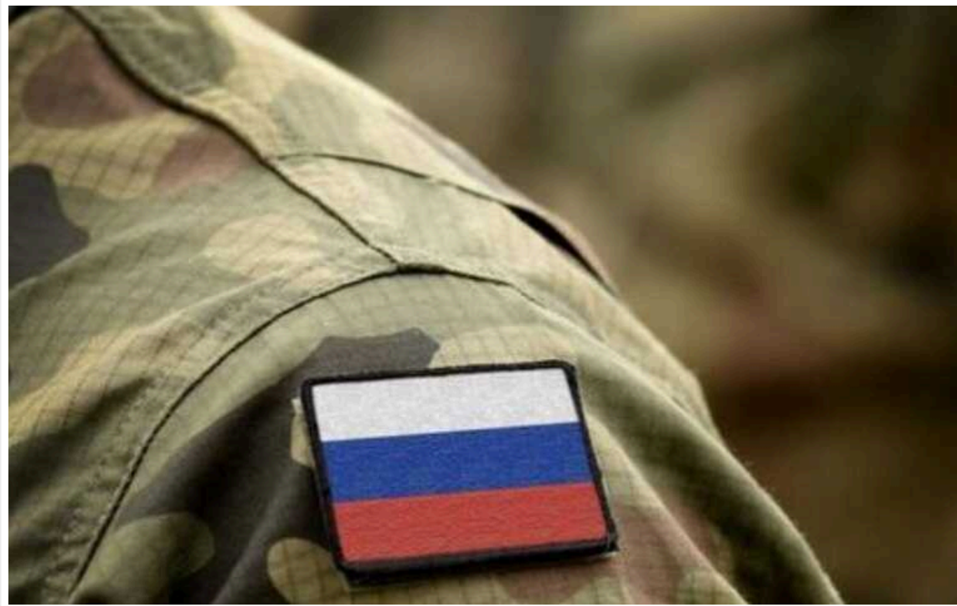
"Нас поливають з усіх гармат", - росіяни плачуть, забившись у нору

Троє наляканих військових РФ, яких командири кинули на смерть штурмувати лісосмугу, записали відео. На момент запису вони вже дві доби сиділи у брудній норі без води та їжі під постійними обстрілами.