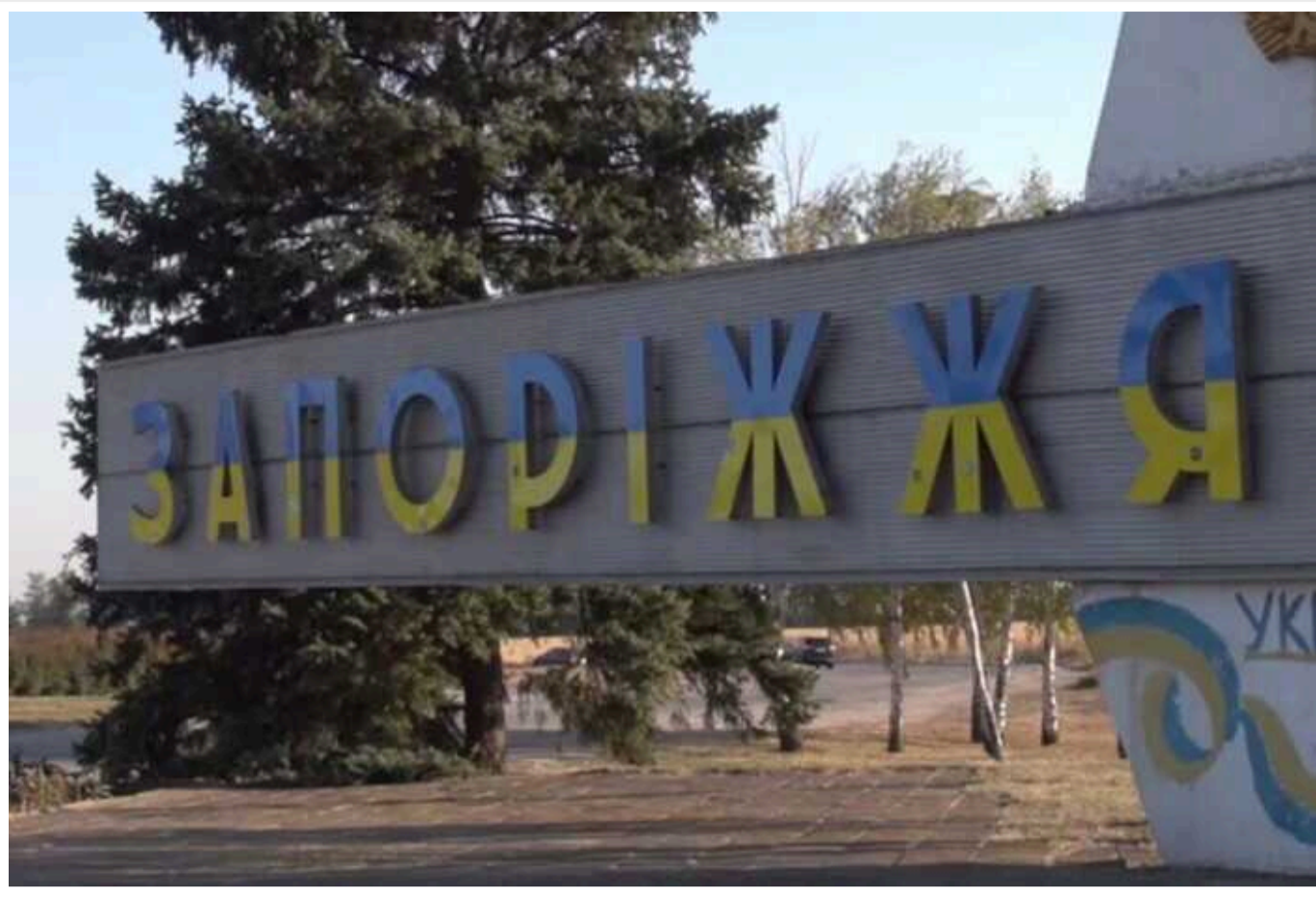
Росіяни атакували у Запоріжжі промисловий об'єкт

Вдень 28 квітня війська РФ атакували промисловий об'єкт у Запоріжжі.