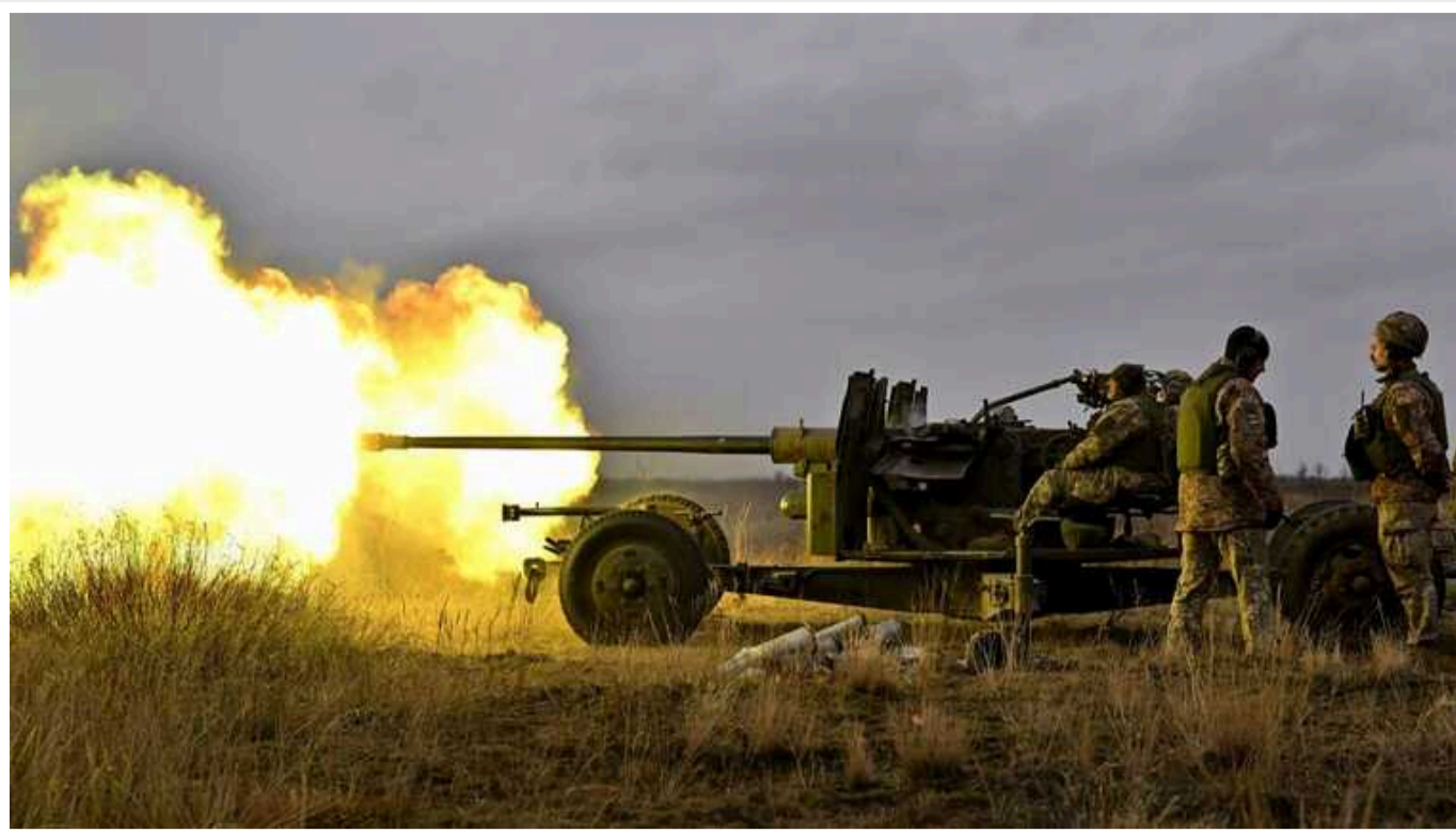
Бійці 3-ї штурмової уразили ворожий окопний РЕБ "Гроза-04М"

Українські воїни з 3-ї ОШБр знищили окопний РЕБ росіян "Гроза-04М". За його допомогою загарбники намагалися бодай якось захиститися від українських дронів.