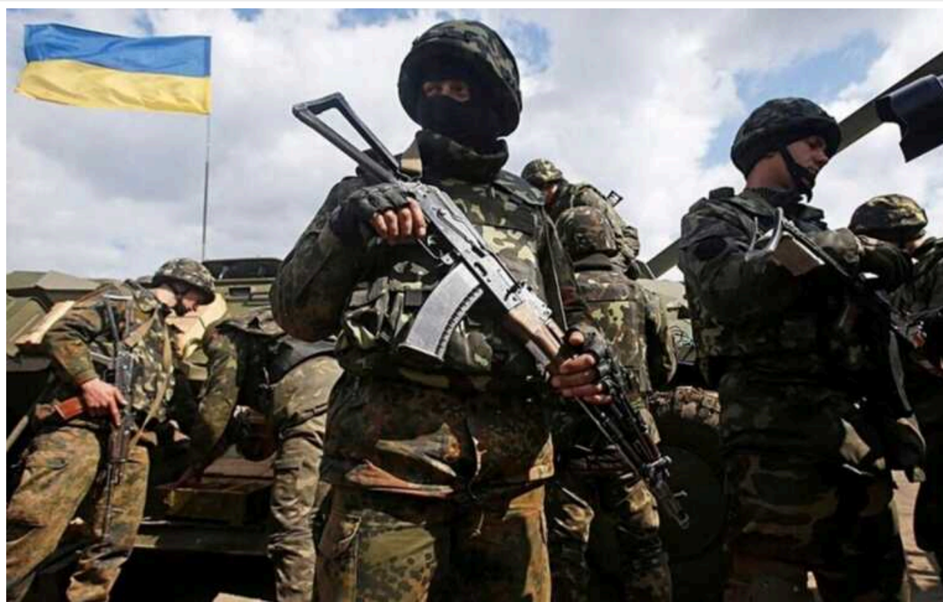
ЗСУ відбили два штурми окупантів на Оріхівському напрямку

Російські окупаційні війська двічі намагалися штурмувати на Оріхівському напрямку, проте отримали відсіч від ЗСУ.