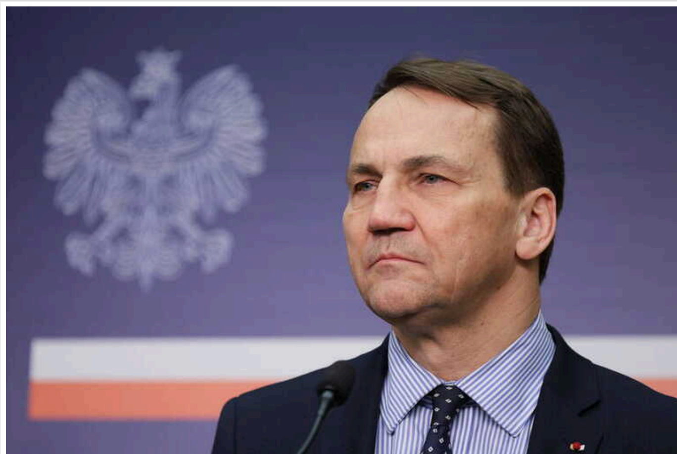
Сікорський: У разі перемоги Путін зробить із Україною те саме, що й Гітлер із Чехословаччиною

Російський диктатор Володимир Путін не задовольниться лише Україною у разі, якщо йому дадуть можливість перемогти.