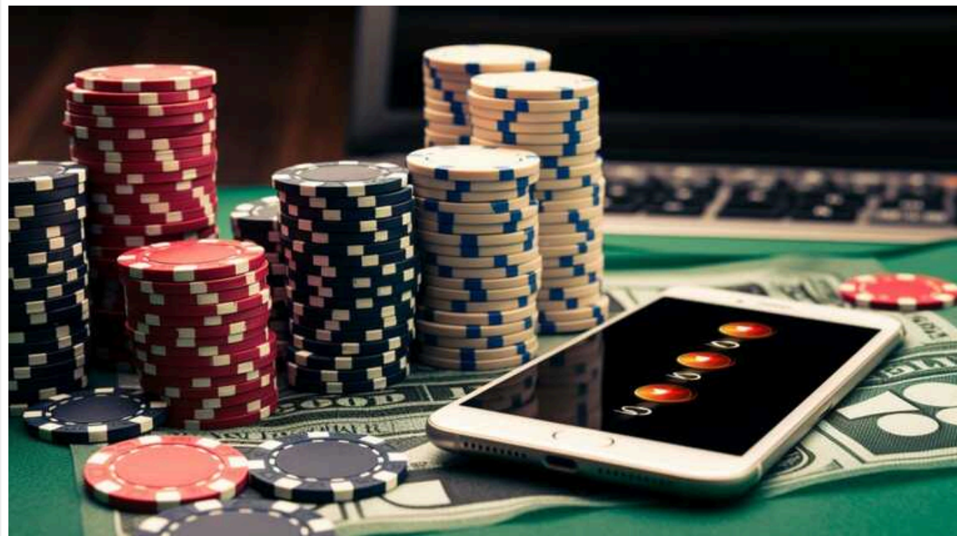
Заблоковано понад 2500 вебсайтів з азартними іграми, – Офіс Генпрокурора

Станом на квітень 2024 року в Україні заблоковано понад 2500 вебсайтів, які забезпечували діяльність проведення азартних ігор, також розслідують понад 450 кримінальних правопорушень за фактами їхньої нелегальної організації, повідомляє Офіс Генерального прокурора.