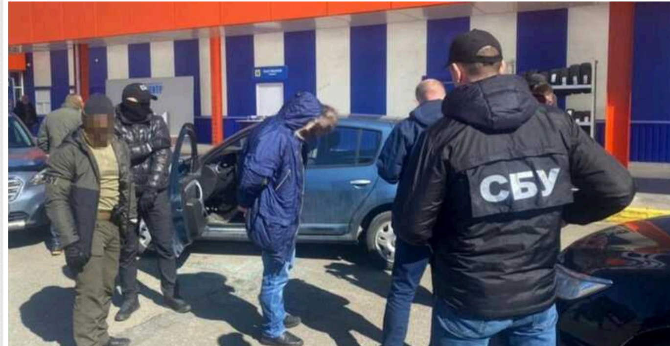
Суд оштрафував експрацівника «Львівгазу» за вимагання 130 тисяч гривень хабара