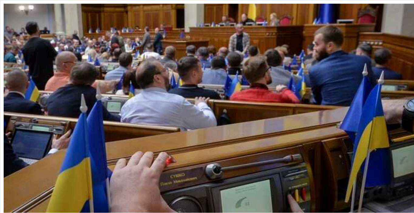
У ВР проголосували закон про колаборацію: звільнити українців будуть через родичів в окупації

Народні депутати прийняли низку змін у Кодекс законів про працю, які торкнуться громадян, котрі, наприклад, мають родичів в окупованій частині України. Згідно з новим законом, їх тепер можуть за це звільнити.