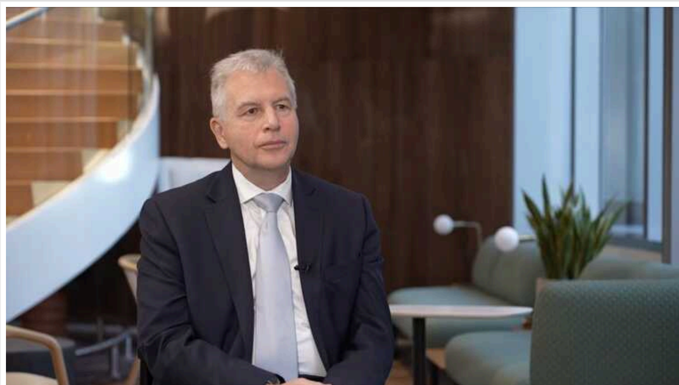
У МВФ висловили оптимізм щодо перспектив української економіки навіть під час війни

Україна навіть під час війни спромоглася уповільнити інфляцію, забезпечити стабільність валютного курсу та зростання економіки, відзначають у Міжнародному валютному фонді. Однак зволікання міжнародних донорів із наданням допомоги змусило уряд вживати компенсаційних заходів.