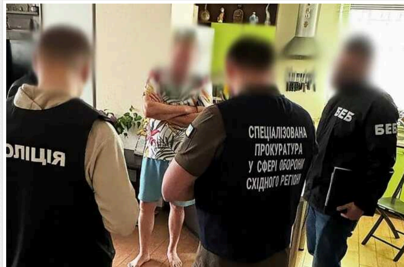
У Дніпрі двох посадовців мерії підозрюють у розтраті понад 8,5 мільйона гривень, які виділили на тероборону

Двом посадовцям Дніпровської міськради повідомлено про підозру в розтраті виділених із бюджету для тероборони Дніпра понад 8,5 млн грн.