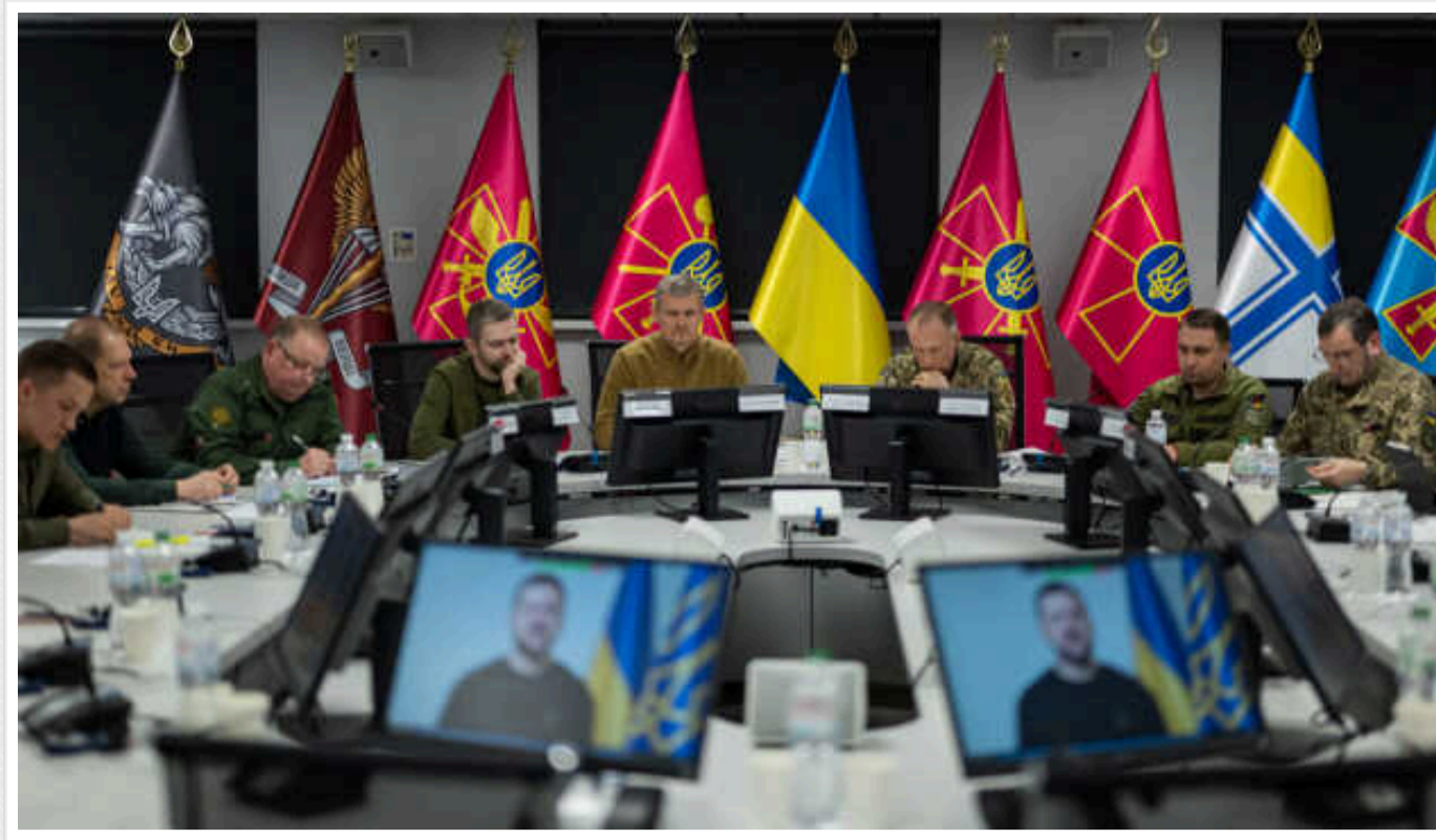
Сирський на «Рамштайні» розповів про потреби ЗСУ та загострення на полі бою

Головнокомандувач Збройних сил генерал-полковник Олександр Сирський поінформував учасників 21-ого засідання Контактної групи з питань обороноздатності України, про складну оперативно-стратегічну обстановку та про нагальні потреби України у озброєнні та військовій техніці.