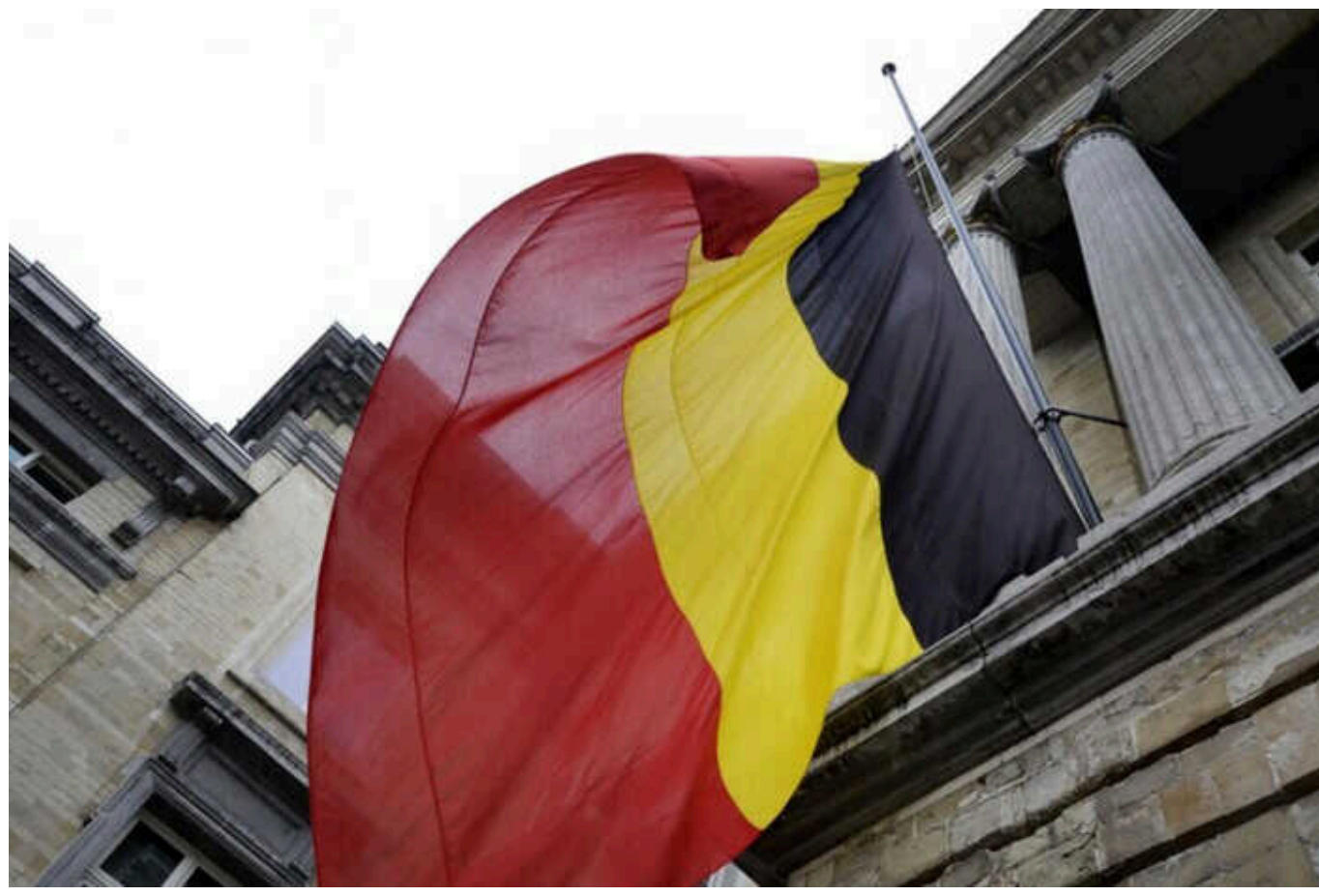
Бельгія виділить 200 мільйонів євро на ППО для України

Бельгія оголосила про додаткову допомогу щодо посилення протиповітряної оборони України для захисту від ракетних і дронових обстрілів Росії. Держава виділить на це €200 млн, а також передасть ракети для ППО.