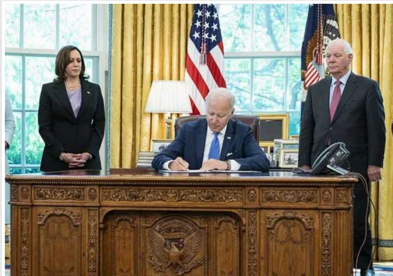
Чи буде продовжено американський ленд-ліз для України

Майже два роки тому президент США Джо Байден підписав акт про ленд-ліз для України, який передбачав передачу американської зброї через механізми оренди або позики. Однак його так і не було застосовано, термін дії документа сплив 30 вересня 2023 року, оскільки він був ухвалений лише на один бюджетний рік. Попри це, українська сторона упродовж минулого року працювала над подовженням Акту про ленд-ліз і на 2024-й фінансовий рік.