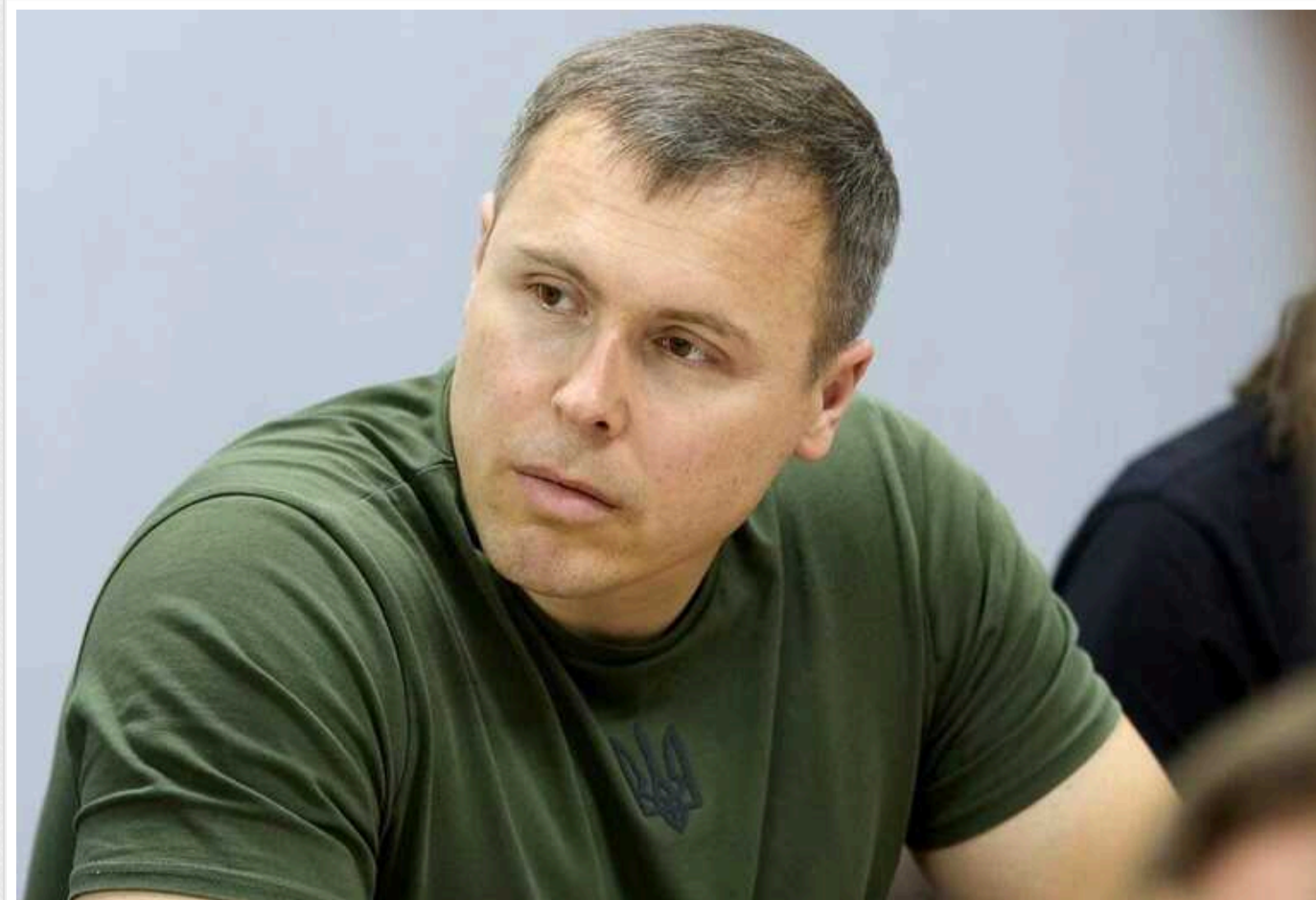
Нардеп Роман Костенко заявив, що люди не стають на облік, противник просувається не лише через відсутність у нас зброї, а й солдатів

Народний депутат з фракції Голос, секретар Комітету Верховної Ради України з питань національної безпеки, оборони та розвідки Роман Костенко в інтерв'ю Radio NV розповів про наслідки провалу мобілізації, проблему з чергами в ТЦК через новий закон й оновлення даних за кордоном.