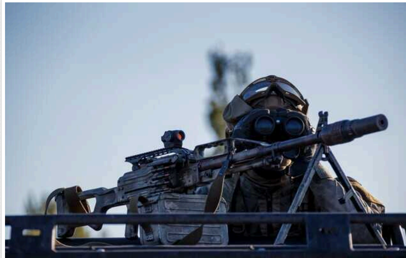
Україна може продовжувати воювати з РФ, але бажана перемога може виявитися недосяжною, - ЗМІ