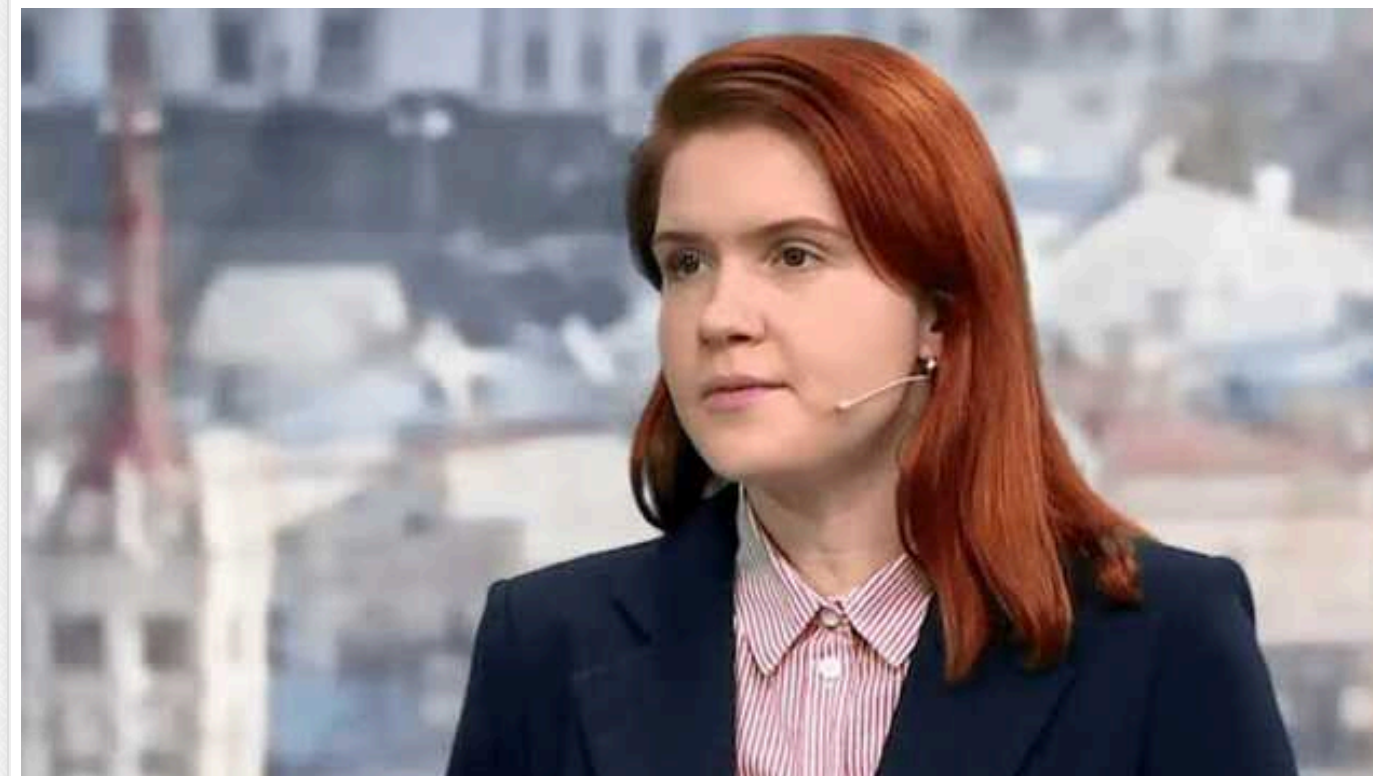
Нардеп Безугла закликала українців за кордоном виконувати свій обов'язок або відмовитися від громадянства

Народна депутатка Мар'яна Безугла закликала українців за кордоном виконувати свій обов'язок. В іншому випадку - відмовлятися від громадянства.