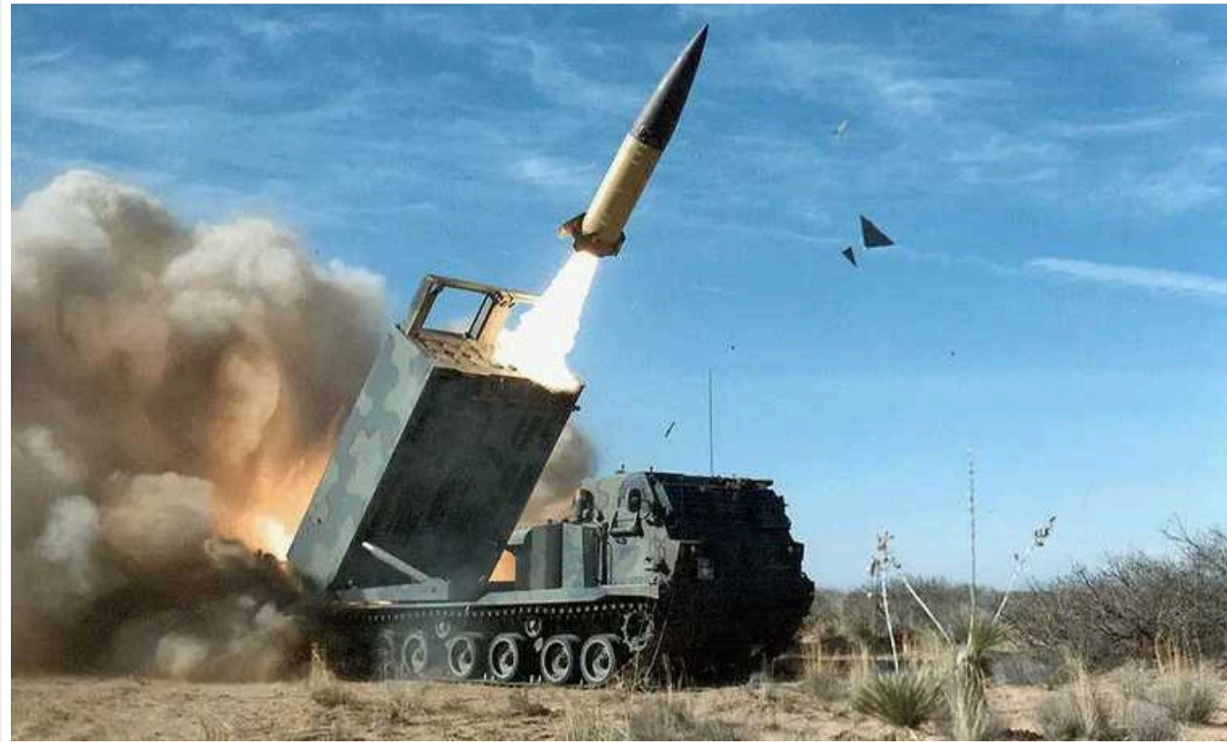
Україна вже отримала понад 100 далекобійних ракет ATACMS, - The New York Times

Видання The New York Times з посиланням на джерела пише, що Україна вже таємно отримала понад 100 далекобійних ракет ATACMS і використала їх проти РФ.