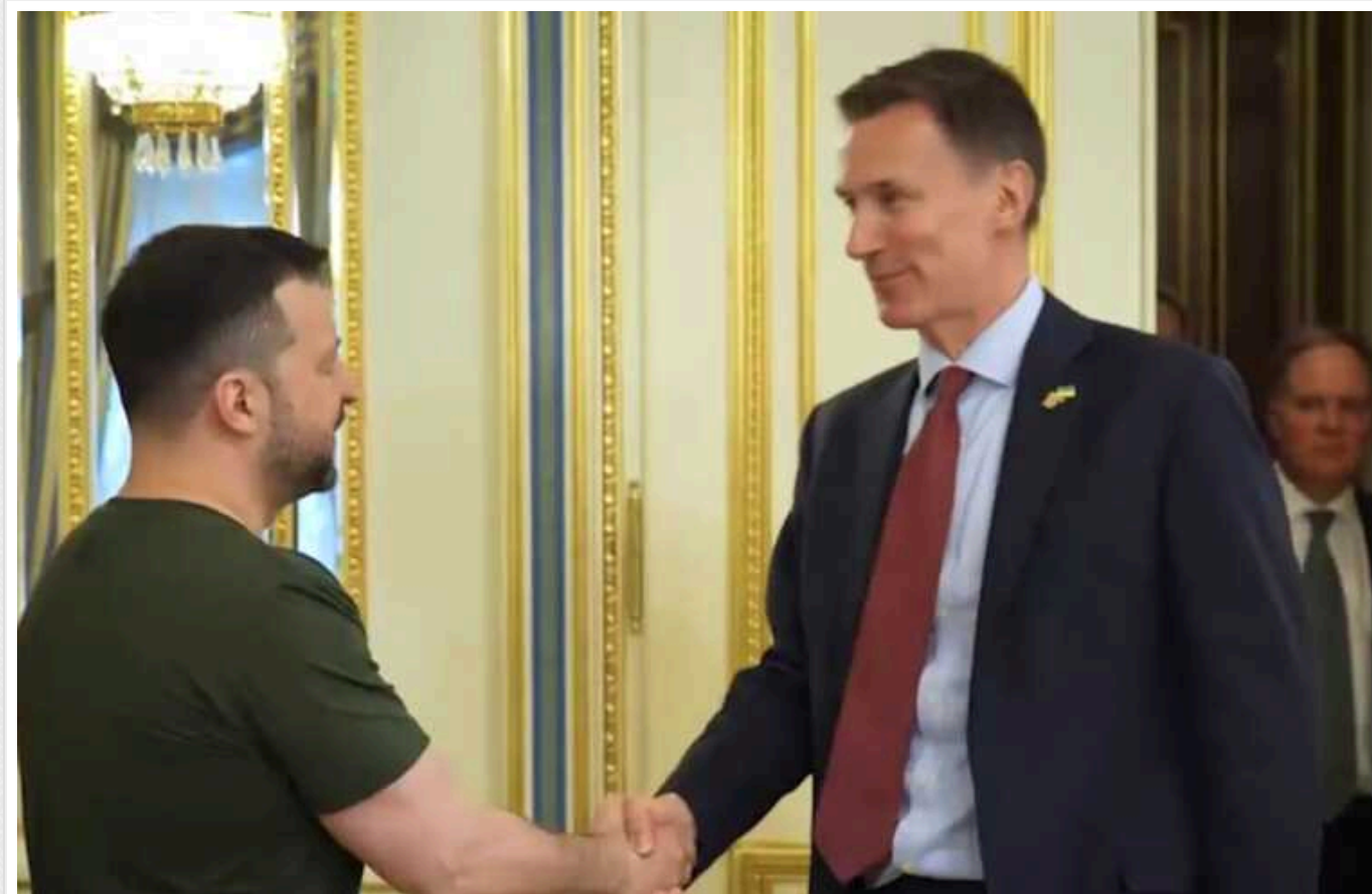
Зеленський зустрівся з канцлером казначейства Британії

Президент України Володимир Зеленський у четвер, 25 квітня, зустрівся з канцлером казначейства Великої Британії Джеремі Гантом. У центрі уваги їхніх перемовин була допомога Україні та санкції проти РФ.