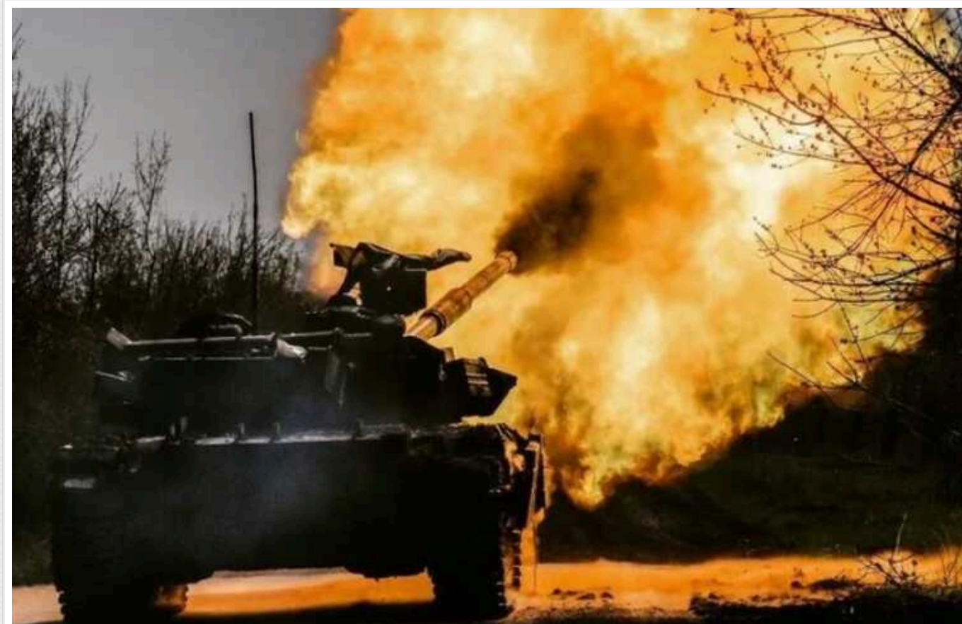
Резніков назвав причини провалу контрнаступу України

Експіністр оборони України вважає, що контрнаступ був надто розрекламований, а очікування надто великими. Крім того, багато з того, чого потребувала країна, партнери досі так й не надали.