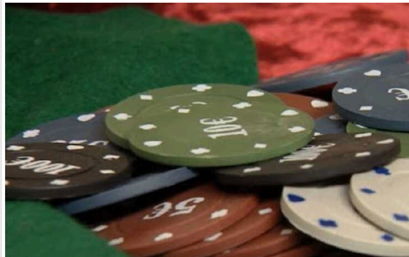
Обмеження реклами казино та "знищення" КРАІЛ: нардепи проголосували за законопроект про азартні ігри

В Україні збираються ліквідувати Комісію з регулювання азартних ігор та лотерей (КРАІЛ). В результаті видача ліцензій у сфері азартних ігор має стати автоматичною, а людський фактор – бути виключеним. Водночас будуть введені обмеження на рекламу азартних ігор. Також очікується посилення контролю у цій сфері.