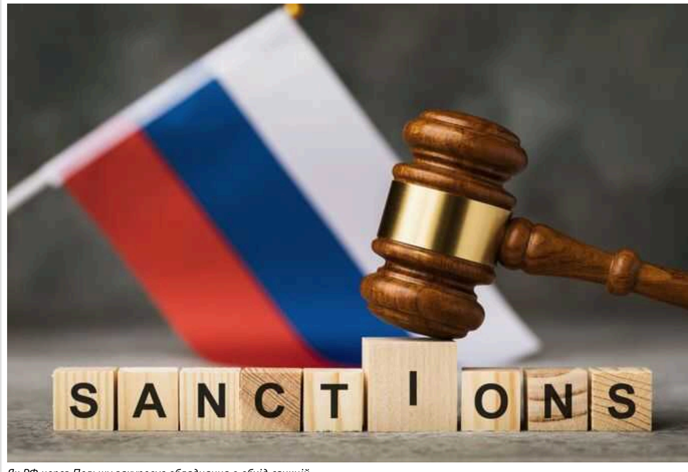
Як РФ через Польщу закуповує обладнання в обхід санкцій

За два з лишком роки війни проти Росії було введено 15628 різних санкцій — це втричі більше, ніж на Іран, підрахувала РІА «Новості». Проте в Росію, як і раніше, потрапляють санкційні товари на мільйони доларів, у тому числі компоненти, необхідні для озброєння.