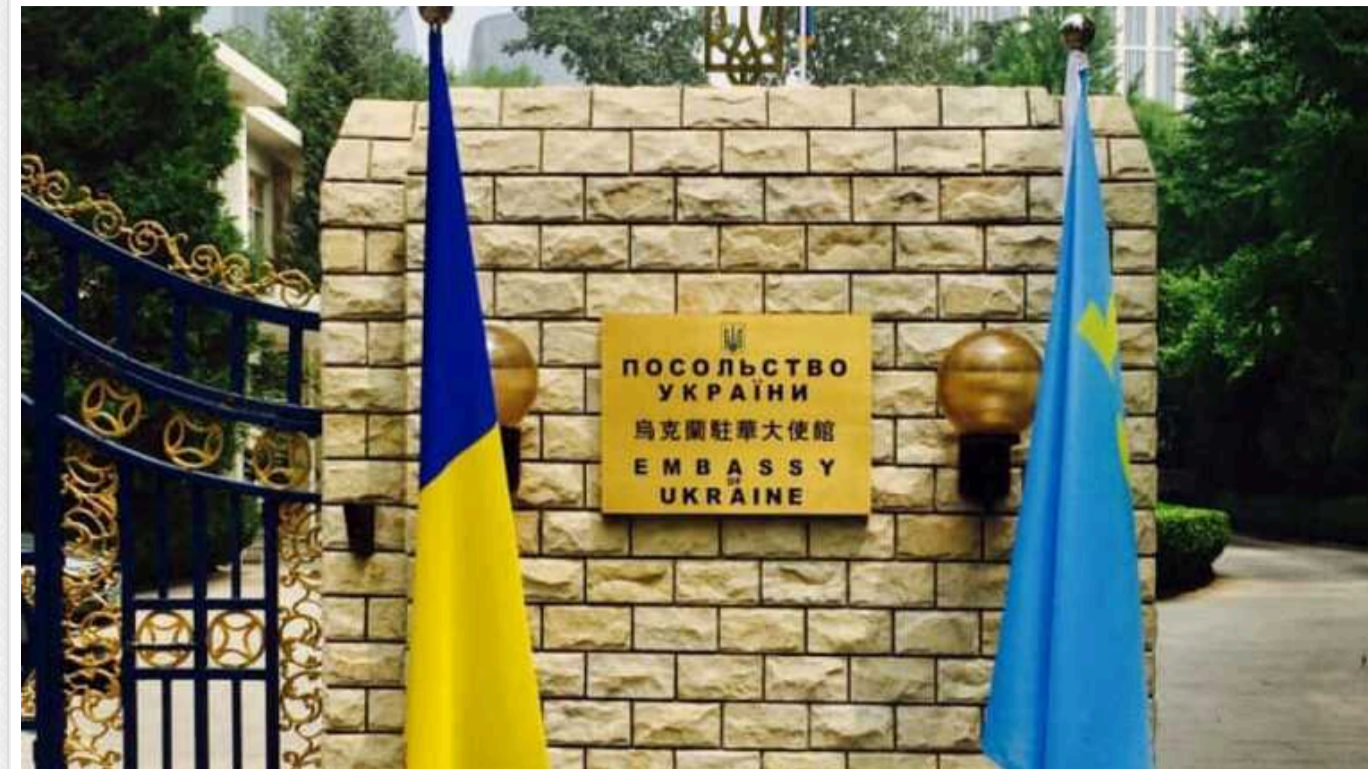
Українське посольство в Китаї підтвердило справжність розпорядження МЗС України щодо громадян призовного віку

Дипустанова також пише, що з сьогоднішнього дня призупинила консульські дії для чоловіків 18-60 років, окрім оформлення документів для повернення в Україну.