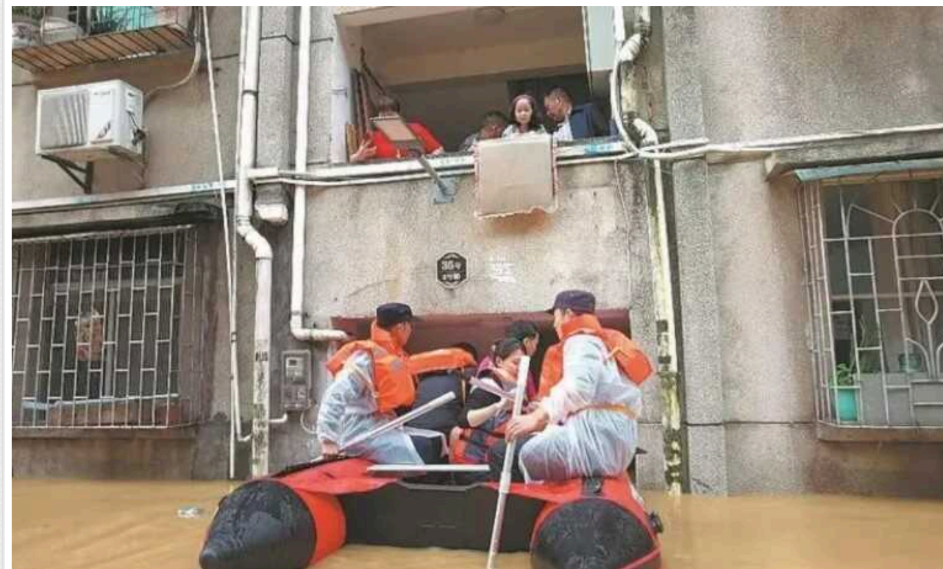
У Китаї через потужну повінь евакуювали 110 тисяч осіб: є загиблі та зниклі безвісти

В Китаї через тривалі дощі, що викликали масштабні повені, в провінції Гуандун було евакуювано 110 000 осіб. У результаті розгулу стихії, за повідомленням державних ЗМІ, чотири особи загинули, а ще 10 зникли безвісти.