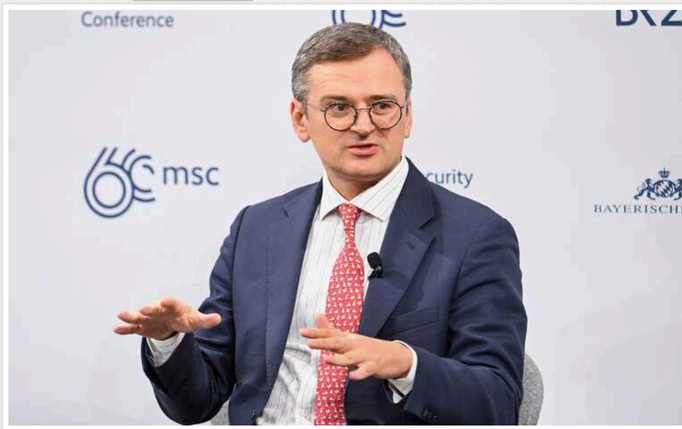
Україна може отримати 4 батареї Patriot, - Кулеба

Рішення щодо надання Україні додаткових систем Patriot готуються, зараз ведуться переговори з відповідними країнами, заявив міністр закордонних справ Дмитро Кулеба.