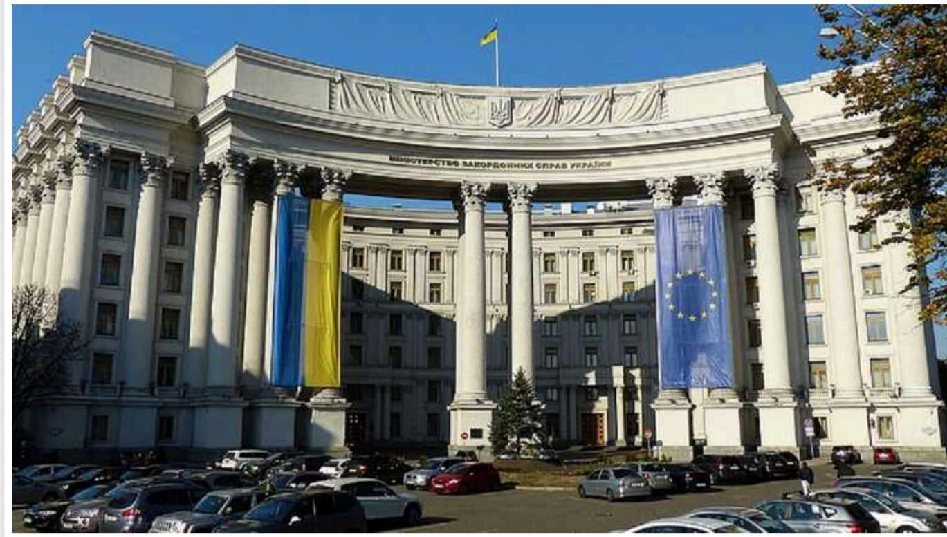
МЗС України заборонило вчинення за кордоном усіх консульських дій щодо чоловіків призовного віку

У листі за підписом першого заступника міністра закордонних справ Андрія Сибіги, опублікованому «Дзеркалом тижня», йдеться, що, починаючи з 24 квітня, можливо лише оформити документи для повернення в Україну.