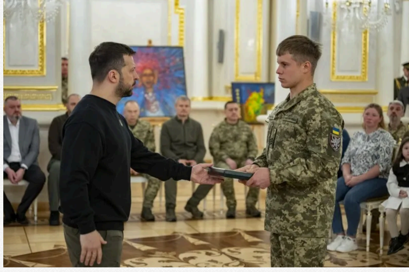
Ордени "Золота Зірка" також були вручені: