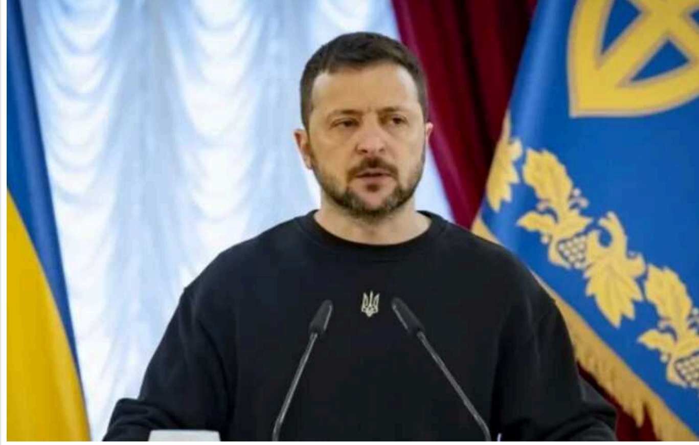
Президент України Володимир Зеленський нагородив військових, які отримали звання Героя України, а також вручив нагороди сім'ям загиблих Героїв, передавши їм ордени "Золота Зірка", а також відзнаки "Хрест бойових заслуг". Він наголосив, що Україна продовжує відзначати хоробрість та мужність своїх воїнів, які захищають рідну землю від ворога.

Про це повідомив Офіс президента. Глава держави зазначив, що світ підтримує Україну, бо саме Україна сміливо й мужньо бореться. "Світ обрав підтримку України, бо Україна сама бореться й робить це справді сміливо. Сьогодні ми відзначаємо найвищими нагородами нашої держави, найвищими боєвими відзнаками людей, які є джерелом цієї хоробрості, які звільняли нашу землю, відбивали українські позиції, рятували своїх побратимів та знищували окупанта. Ми відзначаємо людей, які гідні всеукраїнської вдячності", – сказав він.