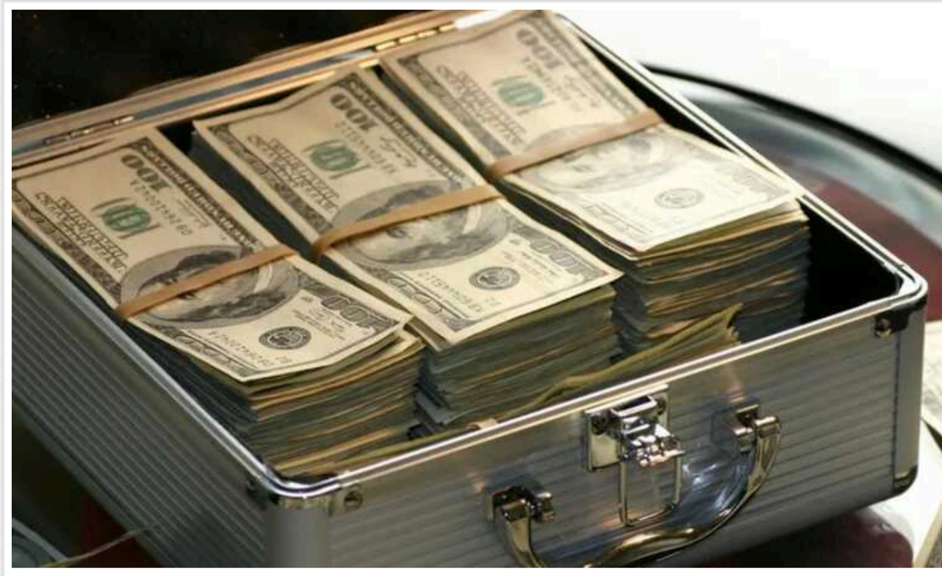
США ухвалили рішення щодо російських активів

США зможуть конфіскувати до $5 млрд заморожених коштів РФ, аби направити їх на відновлення України після війни, а також фінансову та гуманітарну підтримку українців. Це стало можливим після того, як Палата представників США ухвалила відповідний законопроект. Але це не означає, що гроші нам передадуть у найближчому майбутньому, оскільки документ передбачає їх перенаправлення лише після закінчення війни.