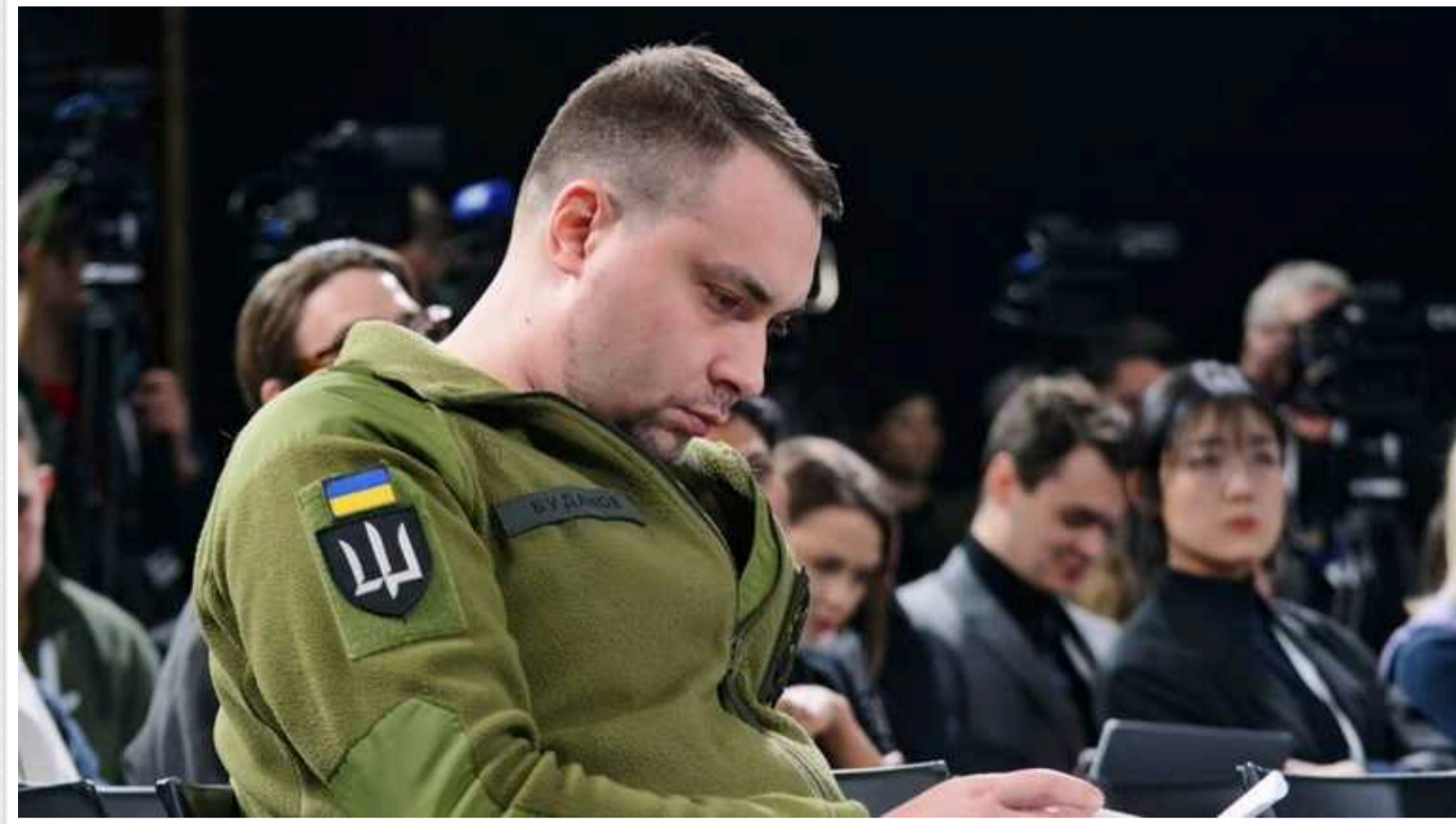
Буданов виступає за ухвалення закону про реєстрацію власників Telegram-каналів

Глава ГУР Кирило Буданов наполягає на ухваленні закону про реєстрацію власників Telegram-каналів.