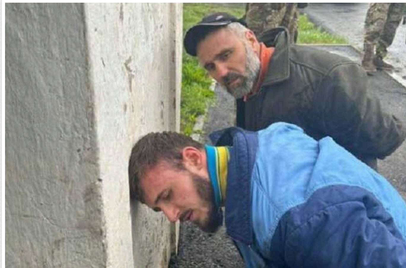
Поліція затримала підозрюваних у розстрілі поліцейських на Вінничині