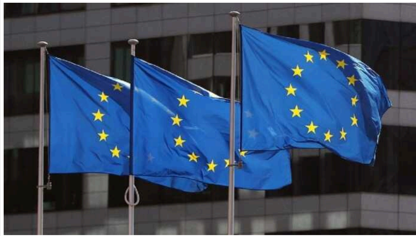
Politico: Євросоюз готує власне рішення щодо військової допомоги Україні, засідання уже в понеділок

Європейські лідери високо оцінили ухвалення в США пакету військової допомоги Україні на $60,8 мільярда. Водночас дехто з них попередив, що Києву вкрай потрібна й додаткова підтримка з боку Європи напередодні, як вони очікують, жорстокого наступу військ РФ у найближчі місяці.