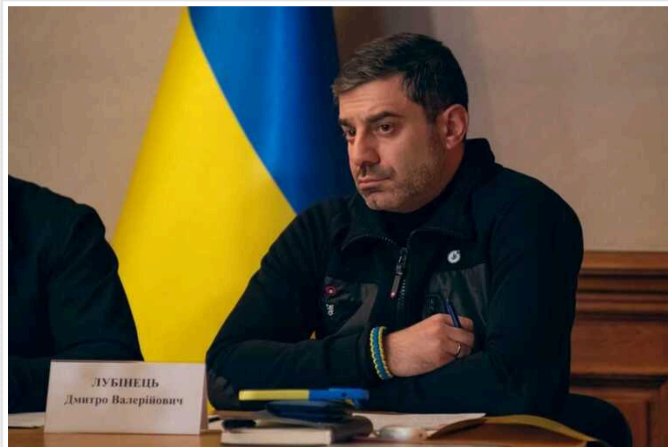
Млява реакція світу стимулює РФ продовжувати вбивати український народ, Росія відчуває безкарність, - Лубінець

Уповноважений Верховної Ради України з прав людини Дмитро Лубінець різко розкритикував позицію міжнародних організацій відносно масованих обстрілів по Дніпру 19 квітня.