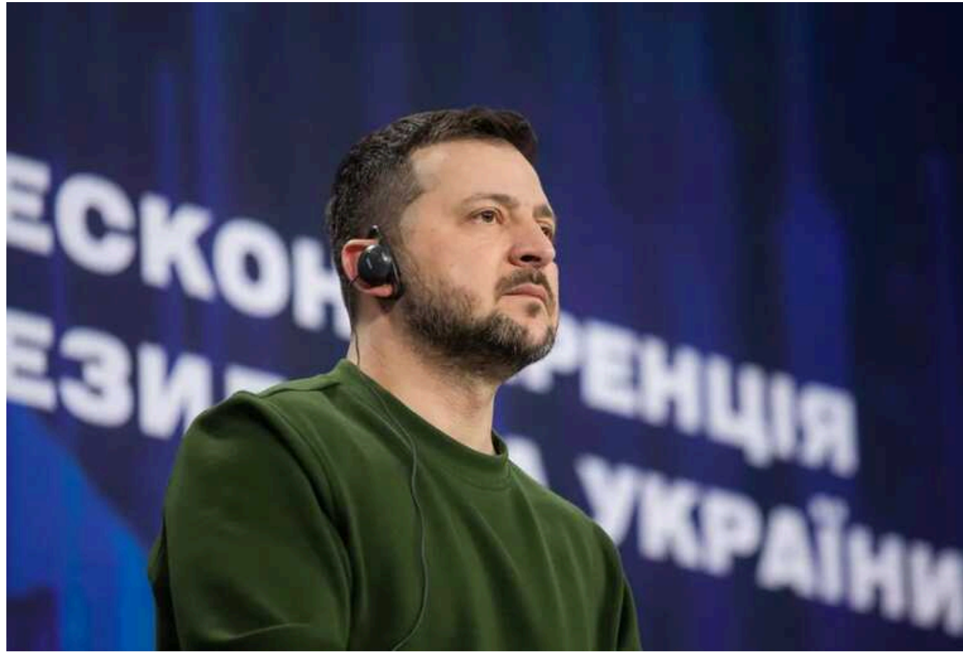
Зеленський звинуватив союзників у "подвійних стандартах" через відбиття атаки на Ізраїль

Читати на руськом Read in English Додати як бажане джерело в Google