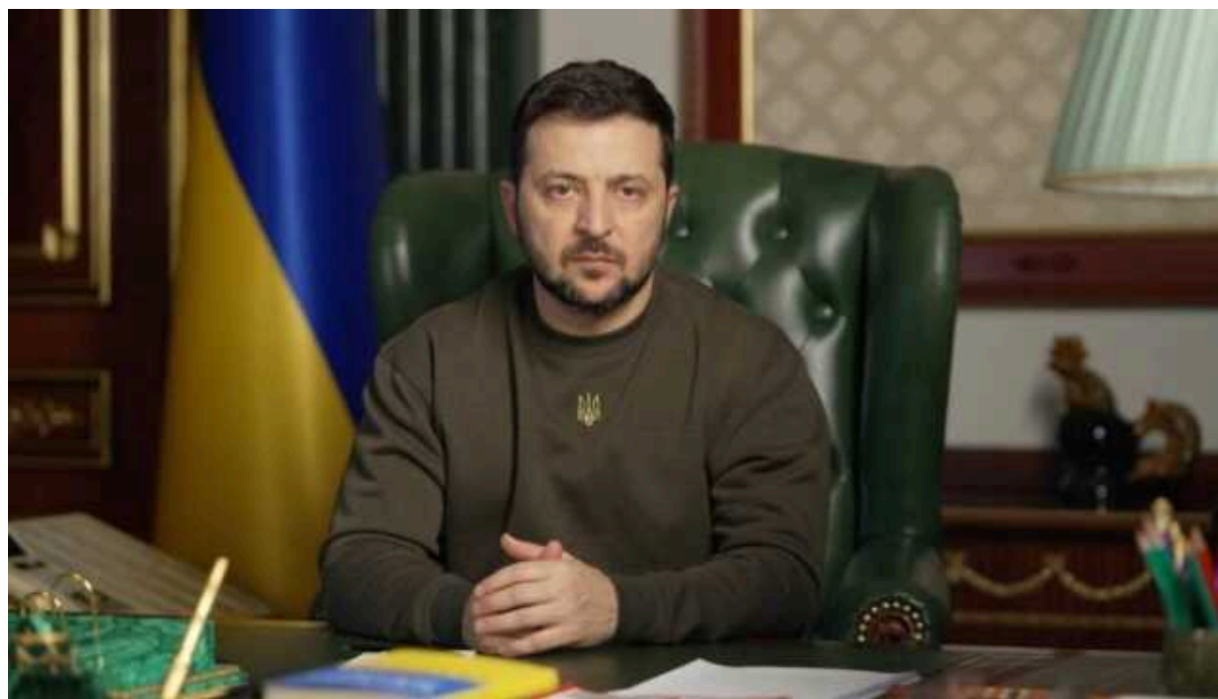
Зеленський: Україна має три джерела фінансової допомоги

Читати на руськом Read in English Додати як бажане джерело в Google